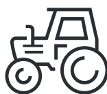
Zemědělská a lesnická technika